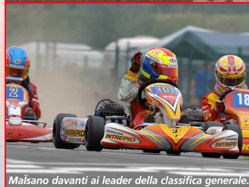
Maï sano davanti ai leader della classifica generale.