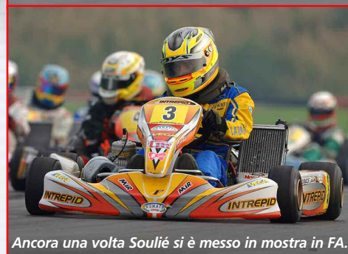
Ancora una volta Soulié si è messo in mostra in FA.